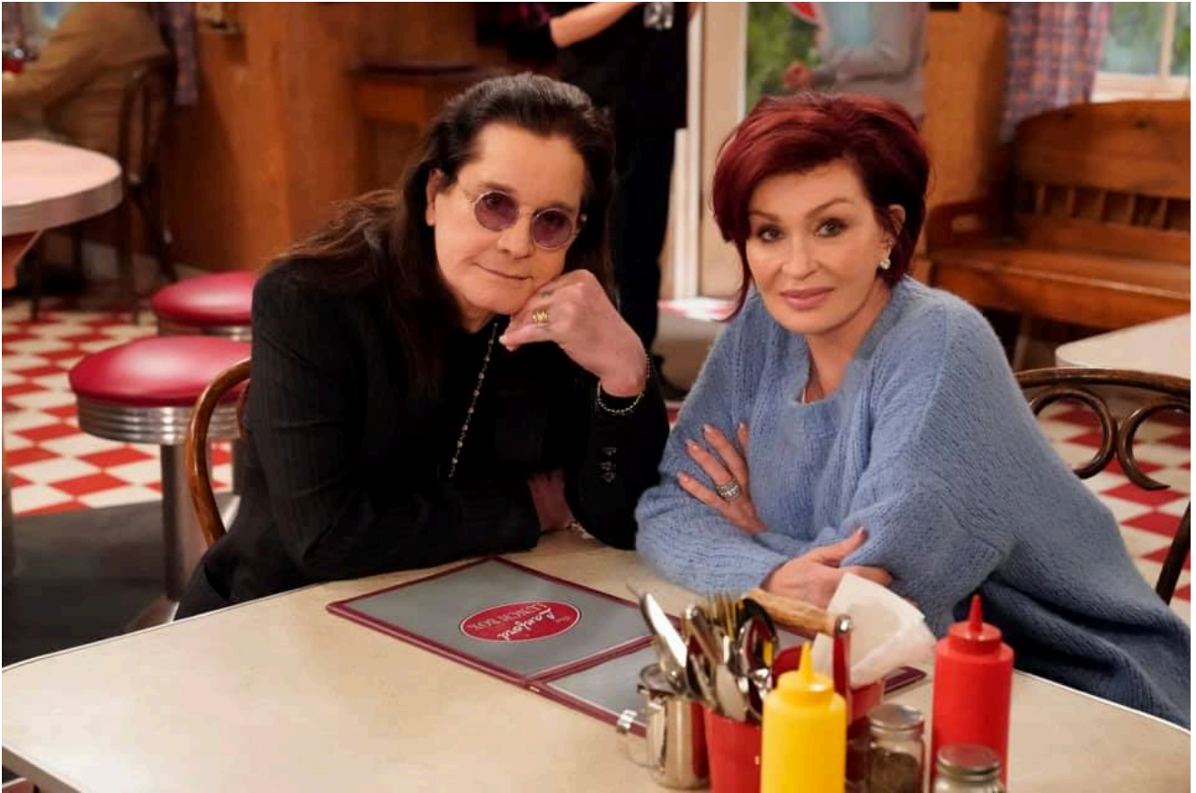
bračni par Osbourne

Osim bračnog para Osbourne, bolnici su još kolica donirali i državljani Srbije koji žive u Kanadi, Peruu i Austriji, a koji su priču o nedostatku kolica pročitali na Fejsbuku.