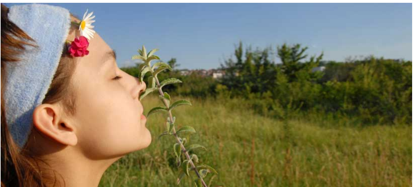
Odmor u Srbiji

Studenti su u obavezi da prilikom podnošenja prijave za dodelu vaučera, prilože original potvrdu visokoškolske ustanove o statusu studenta prvog, drugog ili trećeg stepena, za tekuću školsku godinu, kao i fotokopiju prve, odnosno druge strane indeksa, sa slikom i ličnim podacima.